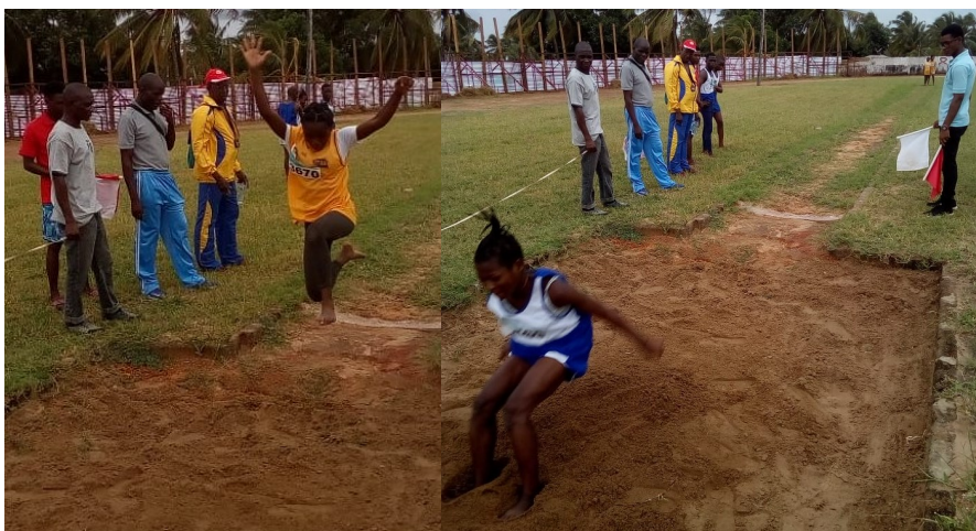
Prova de saltos em comprimento

Na pista do Estádio Municipal da Cidade de Pemba, os atletas realizam as Provas de Lançamento de Peso, Salto em Comprimento de 800m, 100m,