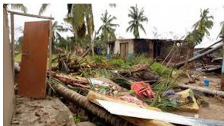
Rastos de destruição na Cidade de Pemba

O ciclone tropical que muito recentemente causou danos materiais e humano, foi mais intenso e deixou um rasto de destruição de infra-estruturas sociais, económicas e de singulares, tendo desalojado milhares na província, e Autarquia de Pemba em particular.