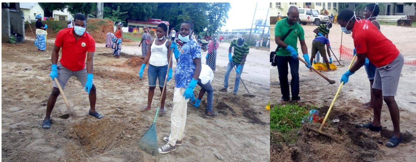
Jornada de limpeza no Hospital Rural de Mocimboa da Praia

L ogo na primeira hora da manhã do sábado, dia 11 de Maio de 2019, um movimento cívico, organizado pelo Serviço Distrital de Educação, Juventude e Tecnologia em coordenação com Conselho Distrital da Juventude, invadiu os espaços públicos e comunitários de Mocimboa da Praia, província de Cabo Delgado, com acções de educação e sensibilização ambientais e de limpeza.