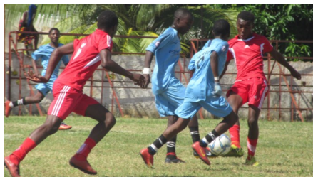
Partida de futebol-Pemba e Balama

A cidade de Pemba, capital da Província de Cabo Delgado, acolheu entre Sábado e Domingo dos dias 25 e 26 de Maio de 2019, os preparativos para a 14ª edição do Festival Nacional de Jogos Escolares, a ter lugar em Agosto próximo, na província de Manica.