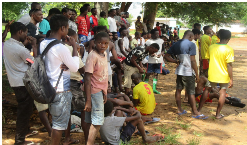
Espectadores presentes no Campo 25 de Setembro

O evento suscitou ideias para superação e deu esperança para as vítimas da intempérie, minimizar os efeitos da tragédia.