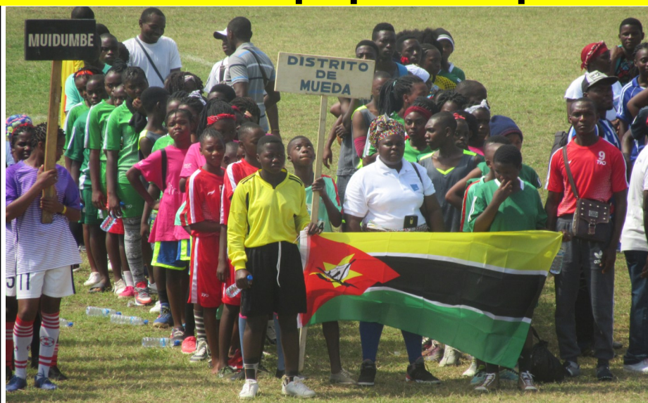
Atletas de diversos distritos e modalidades presentes no festival provincial

A cidade de Pemba, capital da Província de Cabo Delgado, acolheu entre Sábado e Domingo dos dias 25 e 26 de Maio de 2019, os preparativos para a 14ª edição do Festival Nacional de Jogos Escolares, a ter lugar em Agosto próximo, na província de Manica.