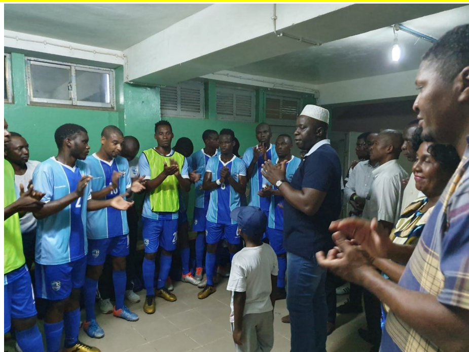
Júlio Parruque, Governador de Cabo Delgado, motivando a Baia no Balneário

A equipa representante de Cabo Delgado no Moçambola Baia Futebol Clube, surpreendeu o público e o campeão União Desportiva do Songo no relvado do Estádio Municipal de Pemba no jogo de estreia da primeira jornada de maior prova do futebol moçambicano.