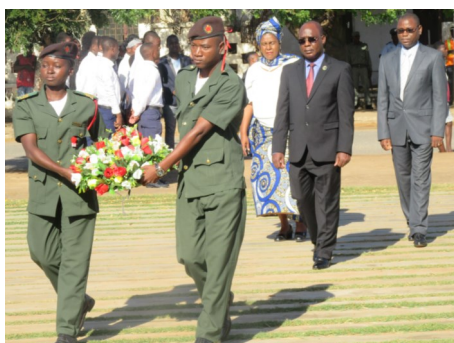
SP, na deposição de coros de flores

A inauguração do evento foi orientado, pelo Secretário Permanente Provincial, António Domingos Mapure, em representação de Sua Excia Governador de Cabo Delgado, momentos depois de deposição de coroa de flores na praça dos Heróis Moçambicanos, por ocasião de passagem dos 56 anos desde a criação da Organização da União Africana (OUA).