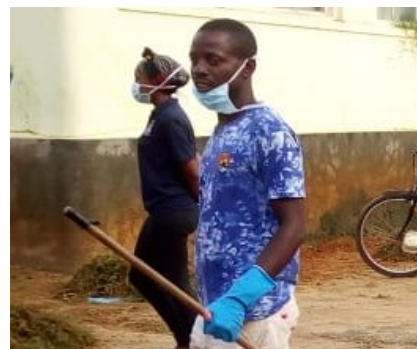
Participante na limpeza

peza, louvaram a iniciativa, mas instam para que ela seja efectuada de forma rotineira.