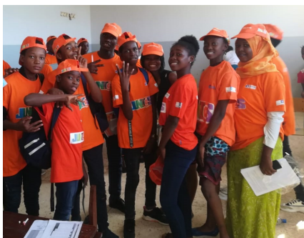
Activista no momento emocionante

o trabalho de conselheiros e sensibilizadores de adolescentes e jovens de várias comunidades escolares sobre testagem voluntária na luta contra o HIV E SIDA, vai contribuir para esvaziar a epidemia no seio da camada.