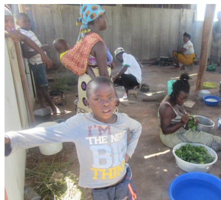
Centro de acomodação do 10º Congresso

quanto avaliavam colectivamente os danos causados pelas intempéries e formas de superação.