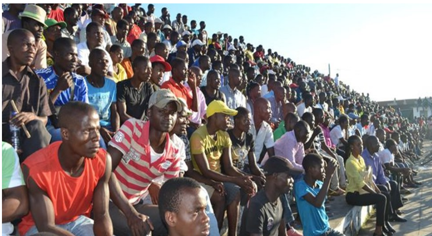
Público presente, no Estádio Municipal de Pemba

A entrada desta equipa no moçambola, quebra um jejum que a província de Cabo Delgado, vem sucumbindo desde 2014.