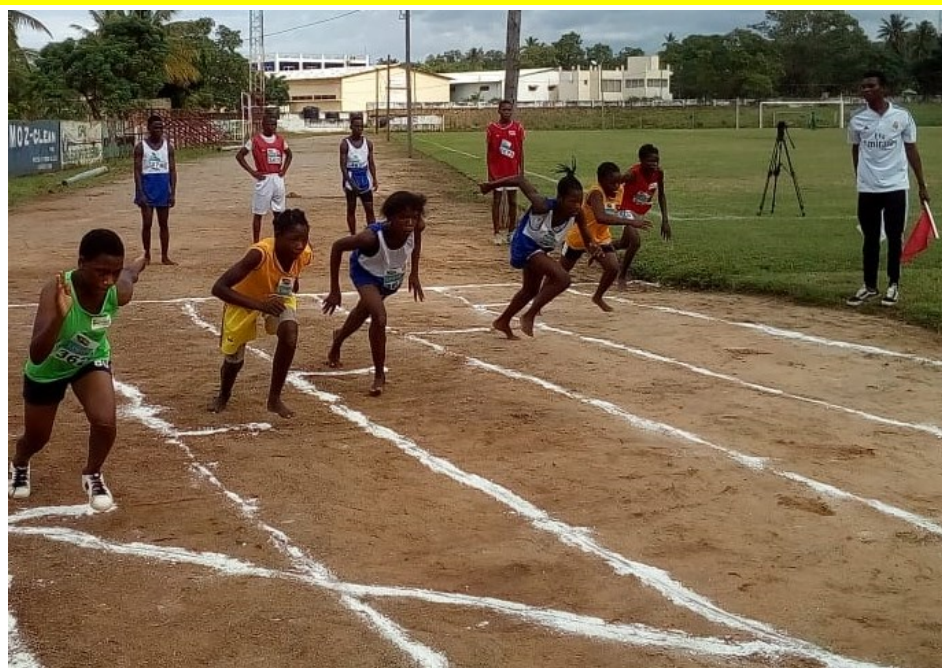
Prova de corrida em 400 metros em feminino

200m e de 400m. assim como Prova Estafeta Sueca (100, 200, 300 e 400 Metros), onde o título ficou com a província de Nampula, tanto em masculinos como em femininos, com 52 e 39 pontos respectivamente.