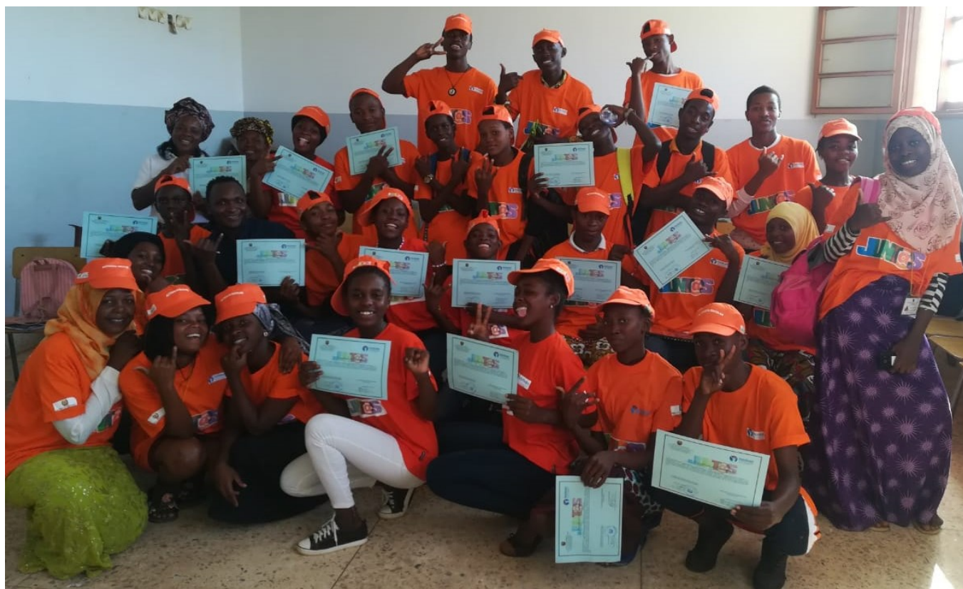
Activistas de base escolar formados em Pemba em Matéria de Saúde Sexual e Reprodutiva

Vinte e dois activistas contra o HIV e SIDA terminaram no dia 26 de Maio de 2019 na cidade de Pemba, província de Cabo Delgado, a formação sobre prevenção, divulgação e aconselhamento contra Doenças de Transmissão Sexual entre outras.